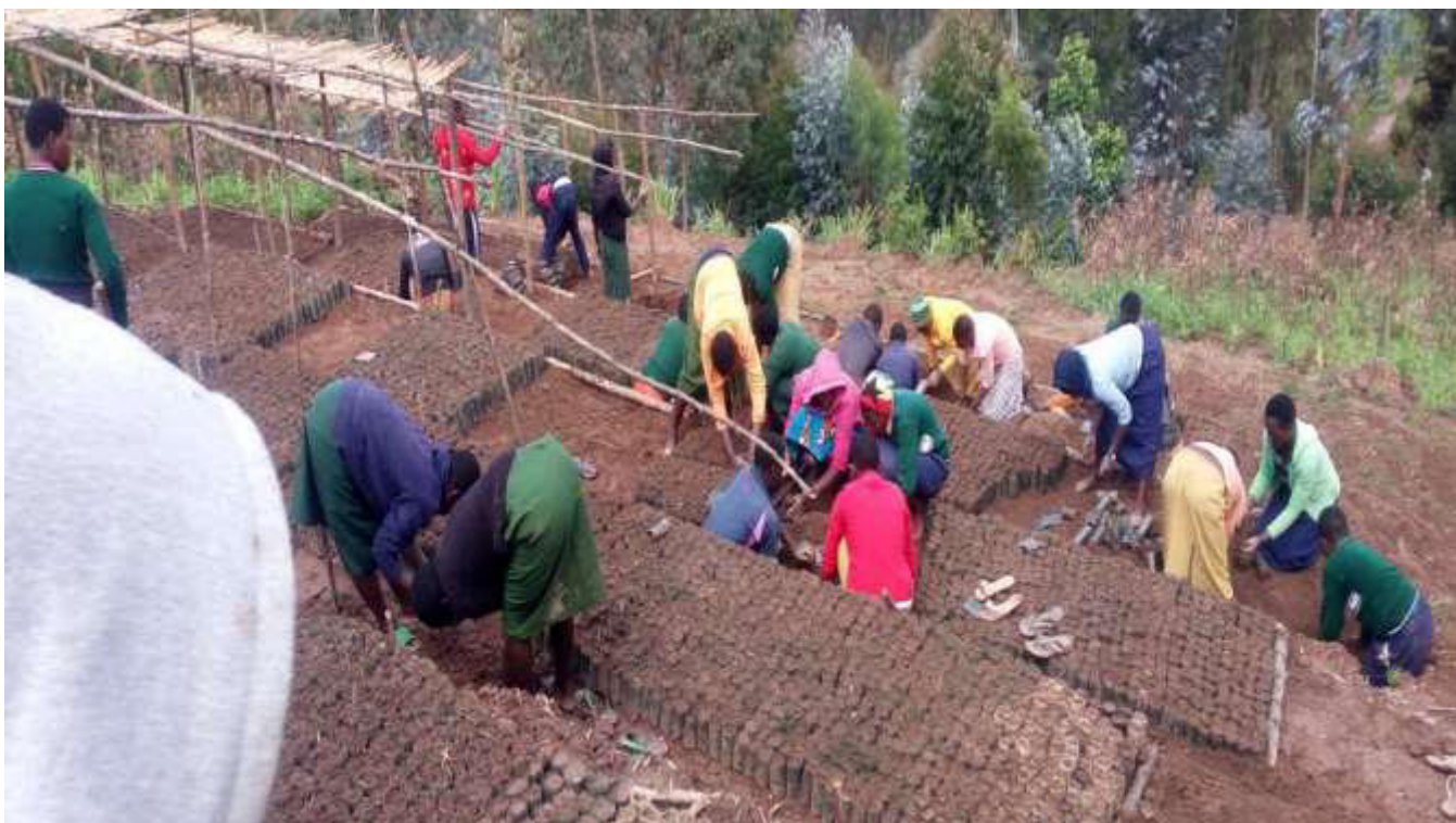
reboisement - préparation des pépinières

Chers amis, aidez-nous à poursuivre ce beau projet et à permettre aux jeunes qui y participent de financer ainsi eux-mêmes leurs frais scolaires et leur minerval ou de gagner un peu d'estime de soi s'ils sont déscolarisés !