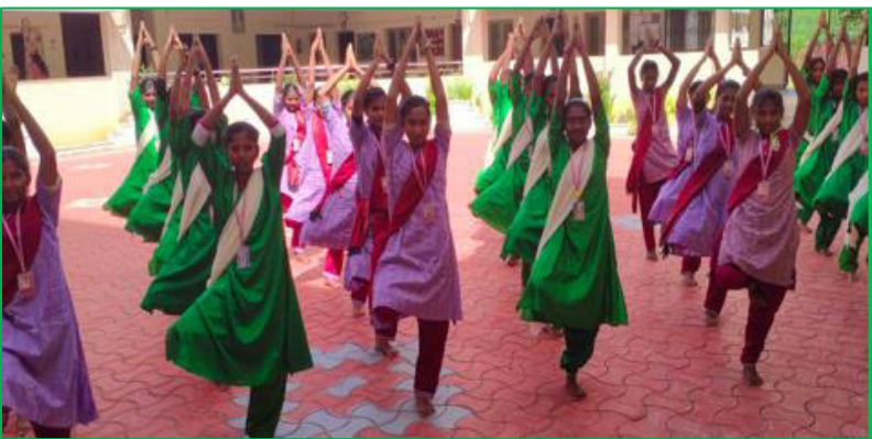
Cours de yoga

Depuis plus d'un an et demi, elles ne venaient plus régulièrement au collège et elles ont eu beaucoup de difficultés pour retrouver l'ancienne vie, la discipline et la rigueur des études au collège, mais elles y sont toutes arrivées et aujourd'hui, tout cela va beaucoup mieux.