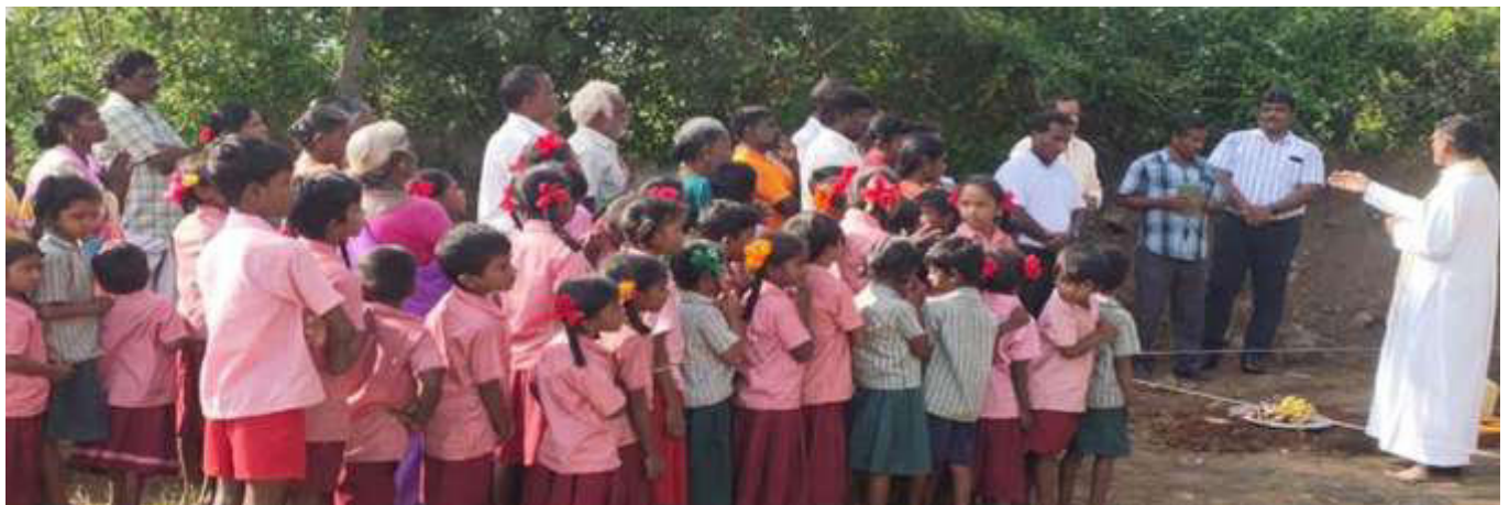
Les photos montrent les offrandes qui ont précédé le début du chantier et la préparation des fondations

Le travail a débuté. Tout se passe bien, avec l'appui des ouvriers et des villageois. Tous proviennent du même village. Bien qu'ils soient très pauvres, les salaires versés pour ce chantier les aident à couvrir leurs besoins de base. Bientôt tous les travaux seront achevés. Nous vous attendons pour dévoiler la nouvelle cuisine à l'usage des enfants. J'espère l'inaugurer le 25 janvier.