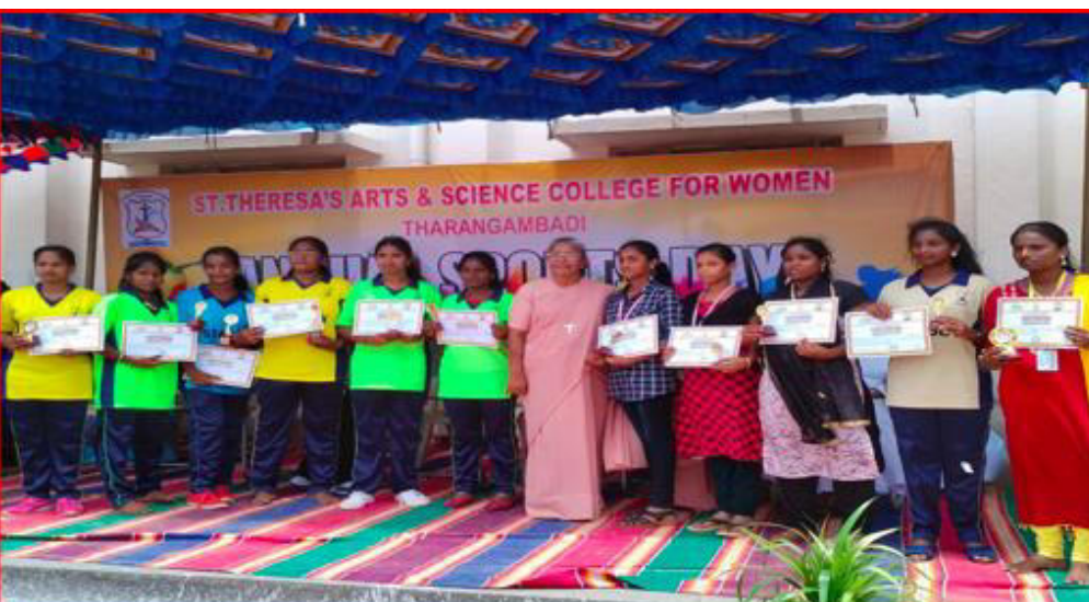
Remise de prix lors d'une compétition sportive au collège

« Je vous assure que l'aide envoyée est dépensée de manière utile et a permis aux filles, en plus d'étudier, de participer à de nombreux concours où certaines ont obtenu des prix et ont pu révéler par ces voies des talents cachés ».