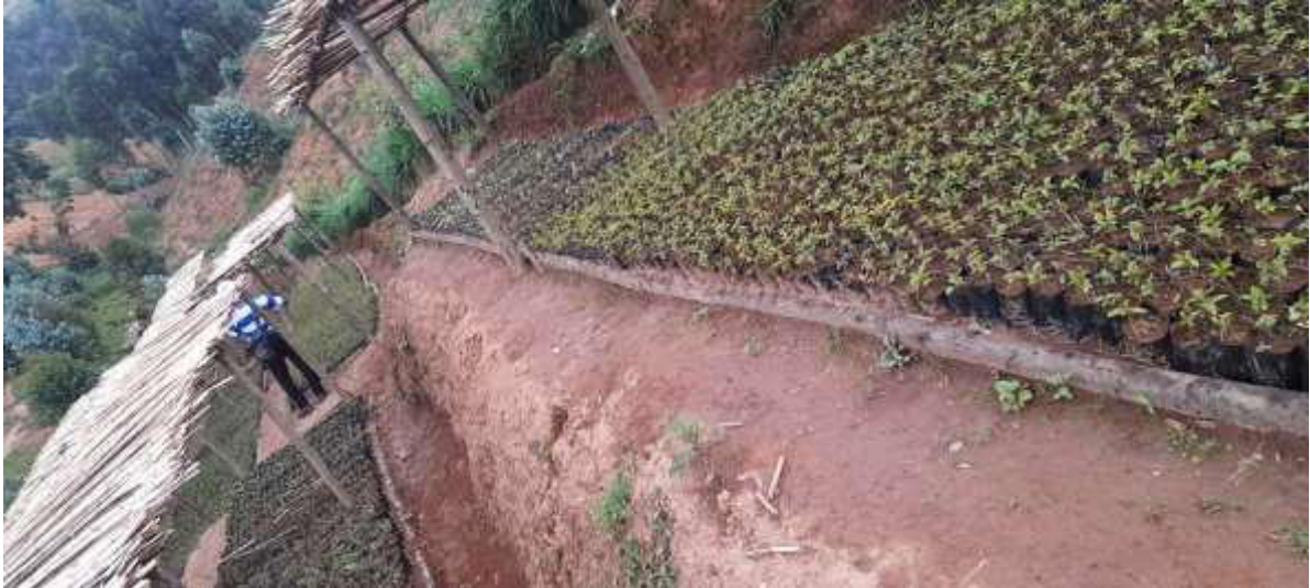
préparation des germoirs

Depuis octobre 2018, un projet de reboisement, soutenu par Enfants du Monde, a vu le jour dans la paroisse de Gakeri au Rwanda. Son but ? Lutter contre l'oisiveté des jeunes durant les vacances scolaires et après les études secondaires, mais aussi soutenir les jeunes déscolarisés en les initiant à un projet concret. Ils trouvent ainsi un but dans leur vie, peuvent avancer et, en étant responsables de leur avenir, ils peuvent grandir et se sentir meilleurs.