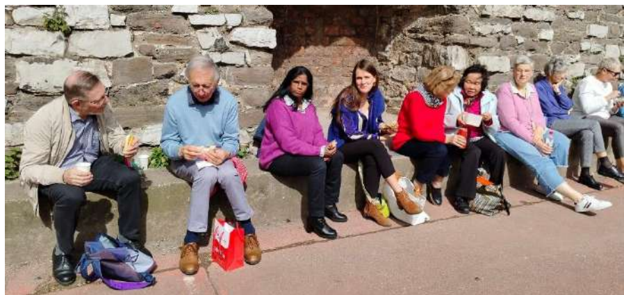
Pique-nique au soleil !

Il ne faudrait surtout pas oublier notre pause conviviale de 12h30, au soleil, autour d'un joyeux pique-nique agrémenté d'un petit verre de vin. Les conversations étaient animées et nous avons pris plaisir à échanger et à partager ce moment.