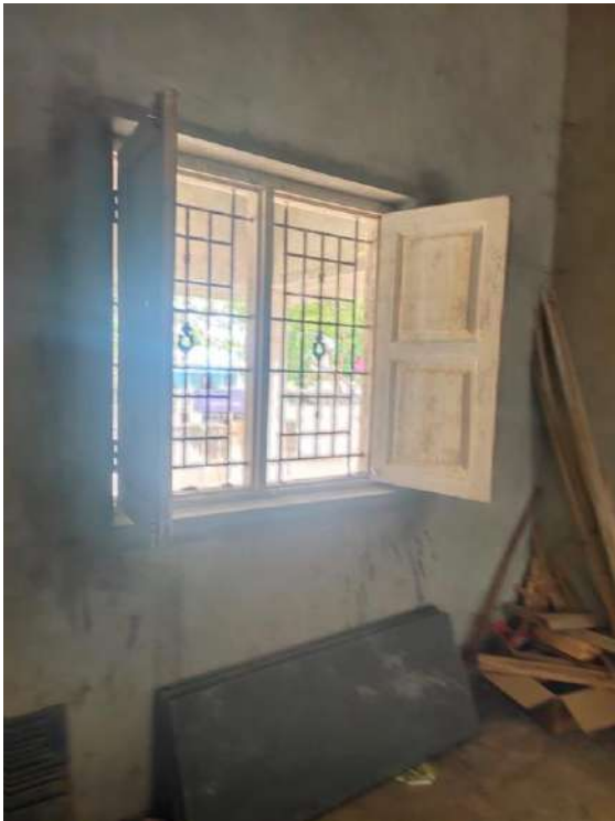
Volet et fenêtres grillagées