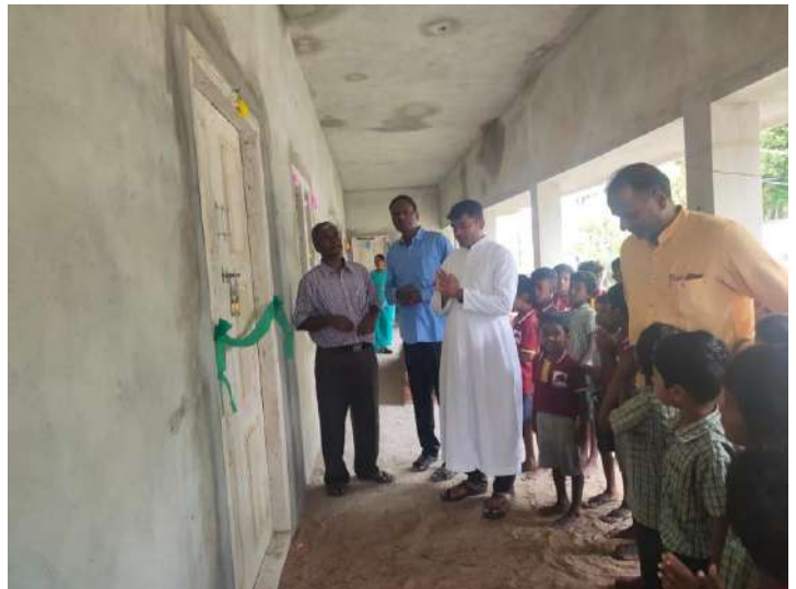
La bénédiction avant l'ouverture des portes