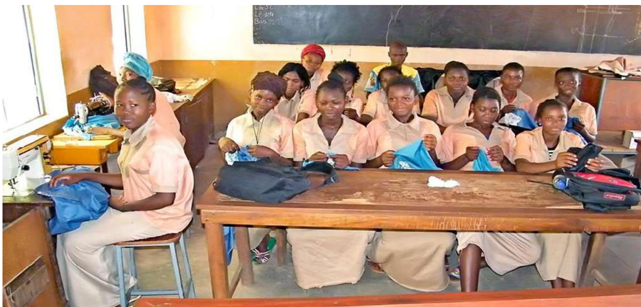
Une classe de deuxième année

Équiper les classes de machines supplémentaires. « Avec leur nombre les élèves doivent travailler en groupe de 6 à 7 personnes pour une machine. Cela rend le travail lent car chacune devra attendre son tour pour avoir accès à la machine. Donc l'augmentation des postes de travail les rendront heureuses ».