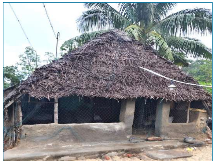
Maison de Gracia Mary et celle de Soviya

Chez Enfants du Monde, nous ne pouvons pas répondre à tous les cataclysmes qui frappent nos Maisons. Nous n'en avons pas les moyens. Et nos projets doivent rester axés sur l'éducation et l'avenir des enfants. Mais c'est bien d'éducation qu'il s'agit lorsque trois jeunes parrainées, en études supérieures, n'ont plus les ressources et le cadre nécessaires pour étudier.