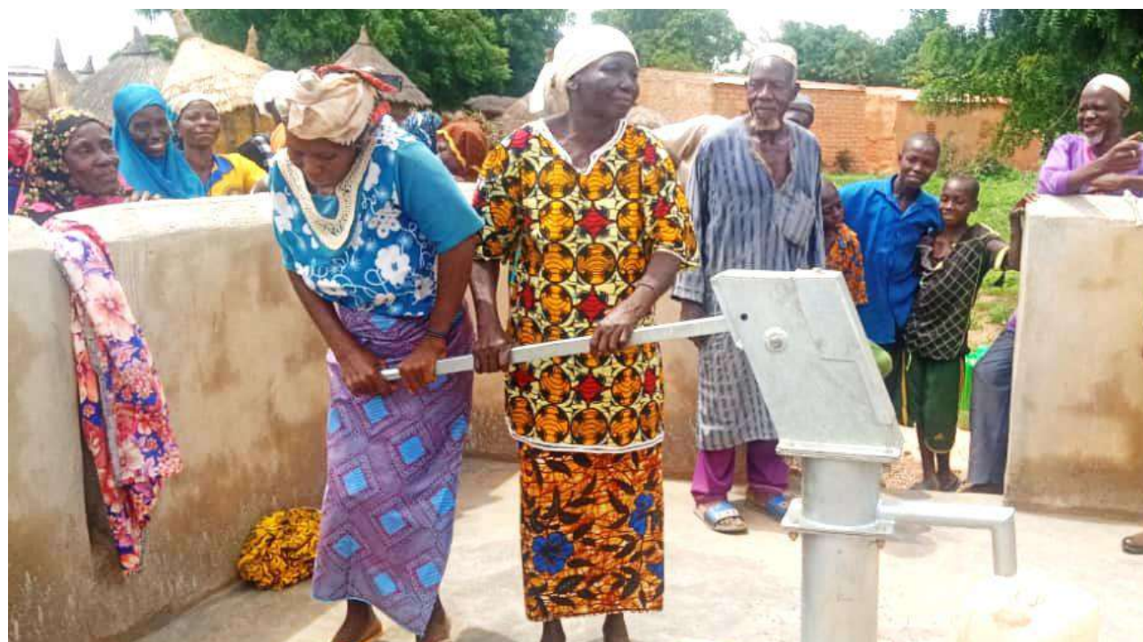
Puits de Yarsyiri

Cette date festive et militante est aussi inscrite dans l'histoire mondiale. Elle nous rappelle que l'égalité des femmes n'est pas un fait acquis (force est de le constater dans bien des pays) et qu'elle s'est traduite au départ, au début du XXème siècle, par des luttes – celles des ouvrières et des suffragettes. N'oublions pas !