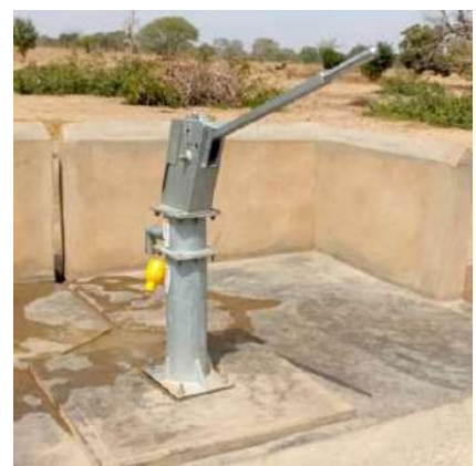
la pompe manuelle

Merci pour votre générosité et votre confiance !