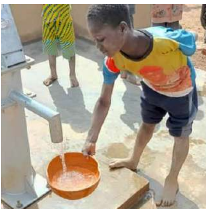
de l'eau potable pour tous

L'inauguration officielle, le samedi 4 janvier 2025, a été un moment de fierté et de reconnaissance pour tous ceux qui ont rendu ce projet possible.