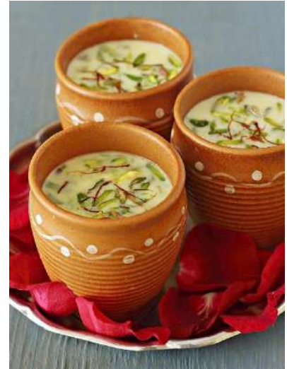
Thandai - CC BY-SA 4.0

Mais Holi ne se limite pas aux jeux de couleurs : c'est aussi un festival gastronomique, où l'on savoure des spécialités comme le gujiya , une pâtisserie délicieuse, et le thandai , une boisson épicée préparée à base d'amandes, de graines de pavot, de fenouil, de poivre, de lait et de cardamome.