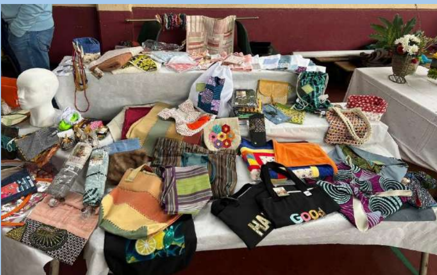
Une de nos nombreuses ventes d'artisanat

Car outre les bourses d'études, une quinzaine de projets sont aussi suivis en cours d'année, soutenus par les Actions du Mois (ACM). La plupart nécessitent une exécution limitée dans le temps mais d'autres, comme les constructions, s'étalent sur plusieurs années.