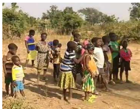
Curieux de voir l'eau gicler ...

Ce puits est une fois encore une réalisation concrète obtenue grâce à la collaboration solidaire de l'IDSF-B au Burkina-Faso et de Enfants du Monde en Belgique. En décembre 2024, un nouveau puits a vu le jour dans la région de Koné, au Burkina Faso, plus précisément dans le quartier de Yirtaoré. Ce projet, réalisé par EDM en partenariat avec l'IDSF-B, l'asbl locale, montre encore que solidarité et réalisation concrète ne sont pas de vains mots pour certaines populations rurales défavorisées.