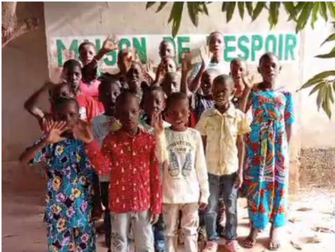
227 Maison de l'Espoir