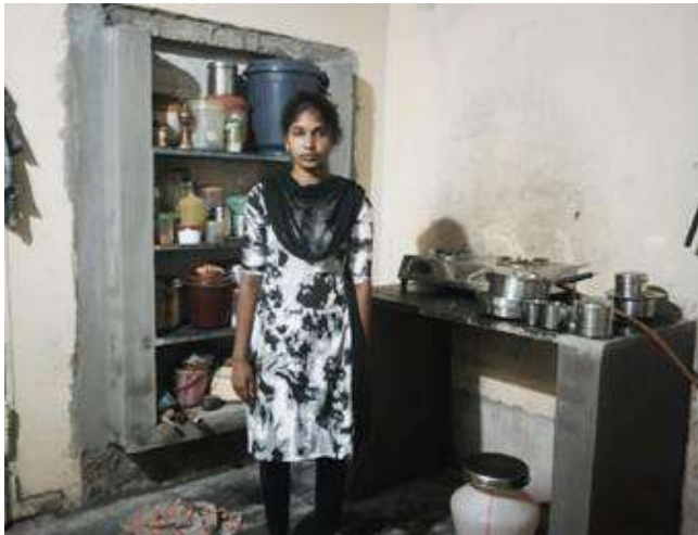
Restauration de la cuisine