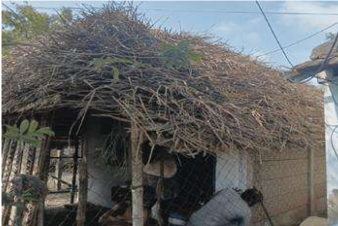
Rénovation des toitures

Cette aide financière a permis la restauration des 3 maisons assez rapidement. Voici quelques photos des travaux réalisés.