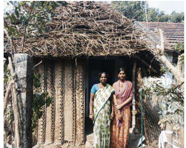
Heureuses d'avoir un toit

Les trois familles remercient du fond du cœur l'association Enfants du Monde pour cette aide d'une grande nécessité. Avoir à nouveau un toit pour s'abriter va leur permettre d'aborder l'année 2025 de manière beaucoup plus sereine.