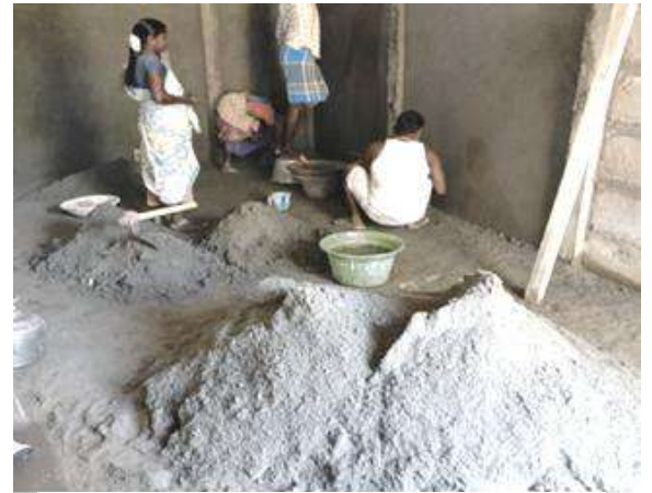
Rénovation de l'intérieur