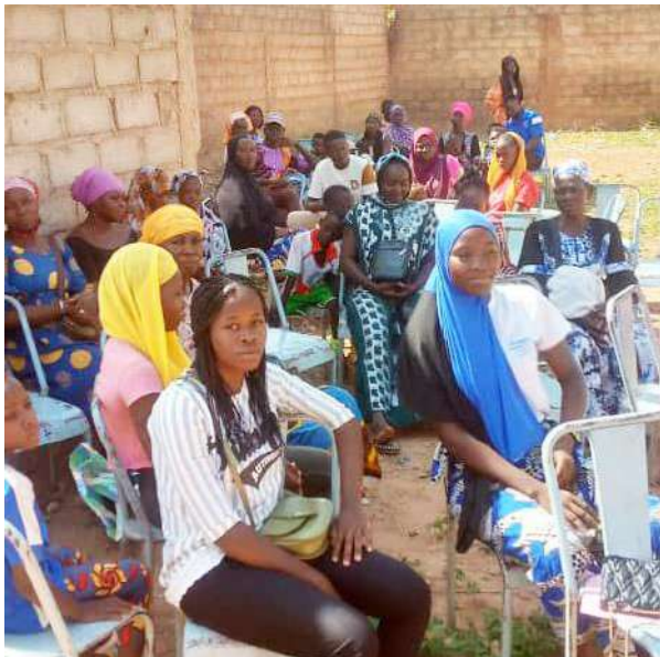
l'attente à l'ombre

Au Burkina Faso, l'année scolaire s'est terminée fin juin. Et pour notre Maison Sig-Noghin, ça s'est clôturé en beauté !